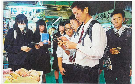
写真を撮り、アプリに取り込みながら那覇の街の移り変わりを学ぶ裾野高校の生徒たち=那覇市・にぎわい広場