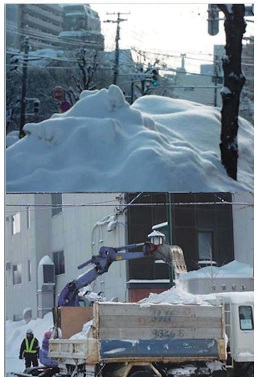
写真①・② 歩道脇に積み上げられた雪と除排雪作業 (2012年12月 札幌市内にて)